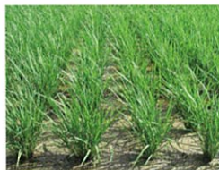
6月下旬、生命力がみなぎって元気に育っています。