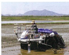
自家農場より弥彦山を望む。