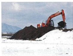
極寒の中での堆肥づくり。